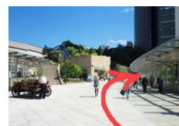
2F広場 (キャニオンストリート)