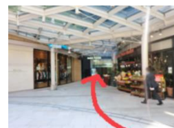
2Fメインエントランス